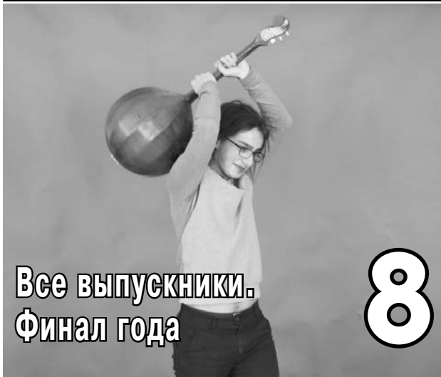
Все выпускники. Финал года