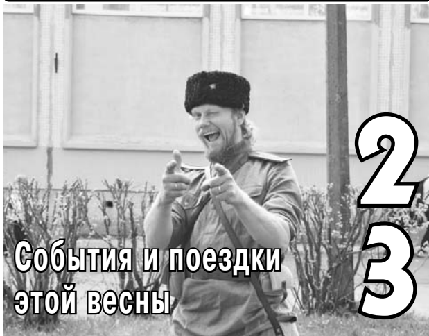
События и поездки этой весны