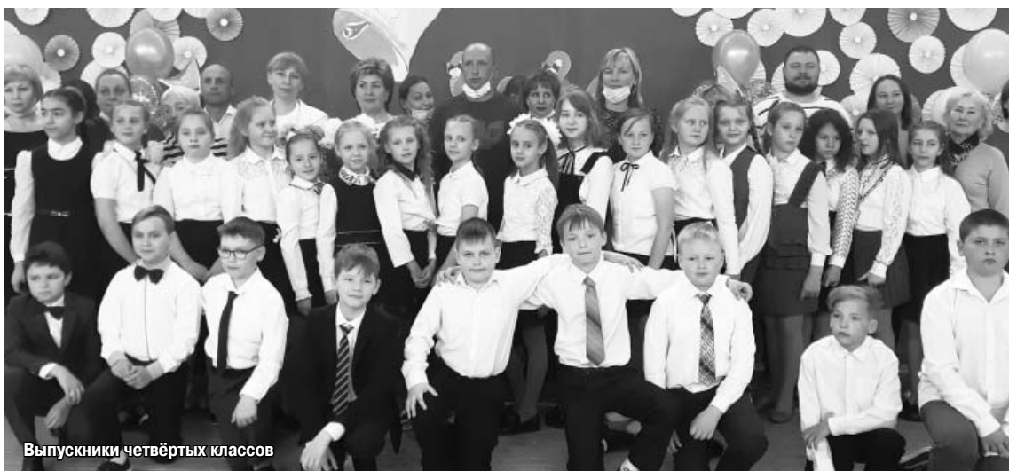
Выпускники четвертых классов