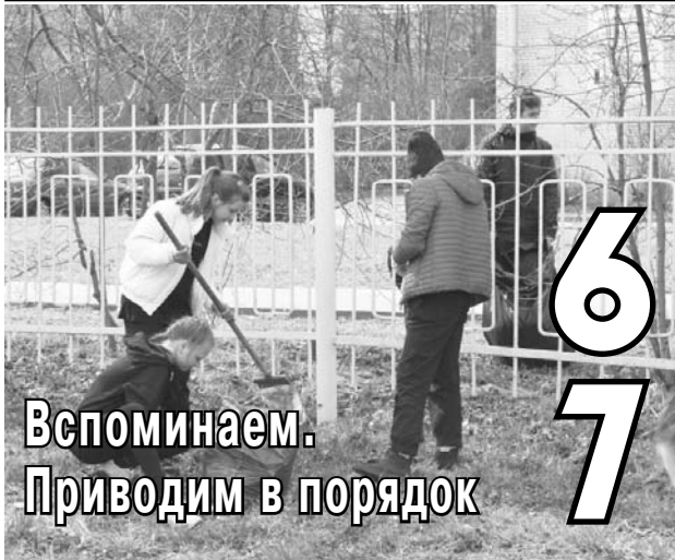
Вспоминаем. Приводим в порядок