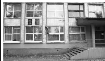
Магаррам Азимов 11 класс, Гимназия №1

Это были самые спорные годы моей жизни. Я не могу сказать, что мне было только хорошо или только плохо: вид мышления «чёрное или белое» мне не свойствен.