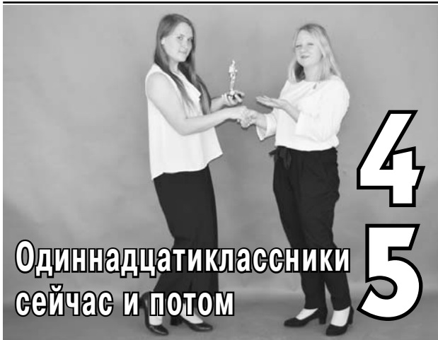
Одиннадцатиклассники сейчас и потом