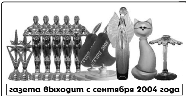
газета выходит с сентября 2004 года

газета детского и молодёжного медиа центра «ВМЕСТЕ» 3 133 2021 город никольское-тосненский район-ленинградская область