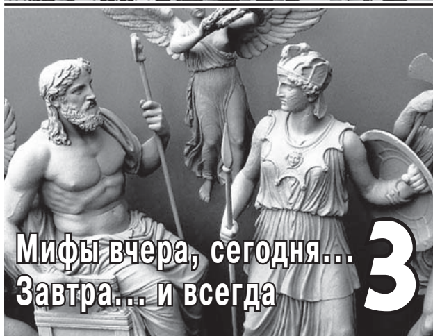
Мифы вчера, сегодня... Завтра... и всегда