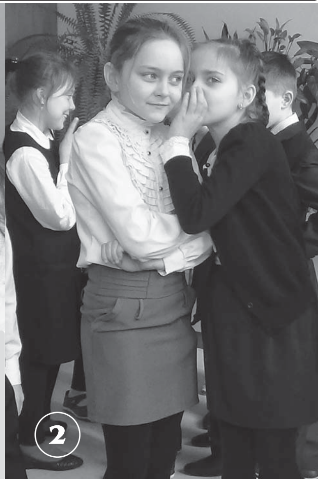
1-й раз: «А ты знаешь?..» 2-й раз: «Слышала, что...» 3-й раз: «Да ну!..» Рождение мифа