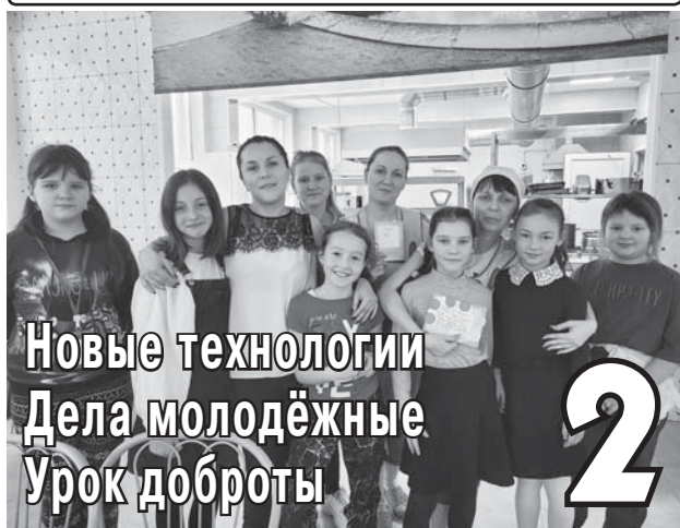
Новые технологии Дела молодёжные Урок доброты