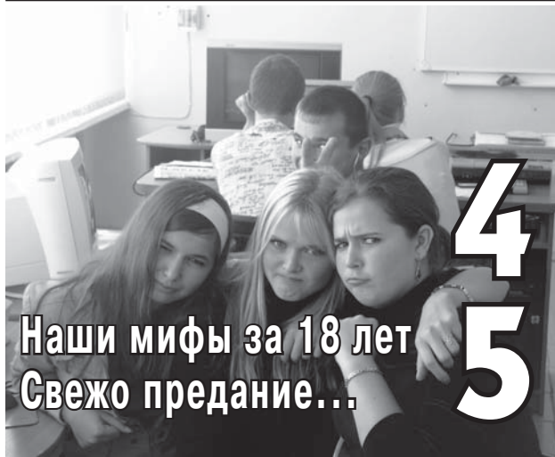
Наши мифы за 18 лет Свежо предание...