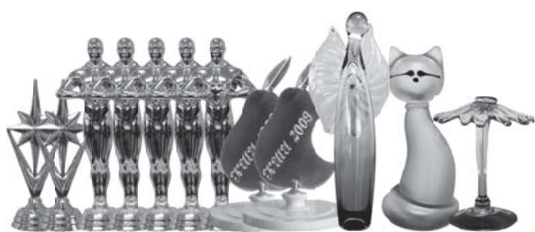
газета выходит с сентября 2004 года