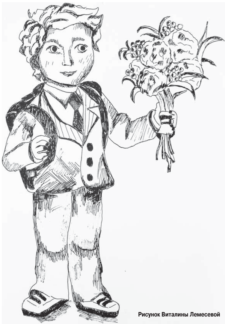
Рисунок Виталины Лемесовой