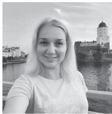
Фото из аккаунта ВКонтакте

Результаты конкурса «Поэтический атлас» будут известны в октябре, а вот по премии Сергея Есенина «Русь моя» стало известно, что на основании Решения Президиума РСП, я буду награждена медалью Сергея Есенина за 2022 год. Это радость и большая честь для меня, я была счастлива уже тому, что мои стихи будут в этом сборнике. Моя медаль ждёт меня, и это придаёт мне сил и вдохновения!