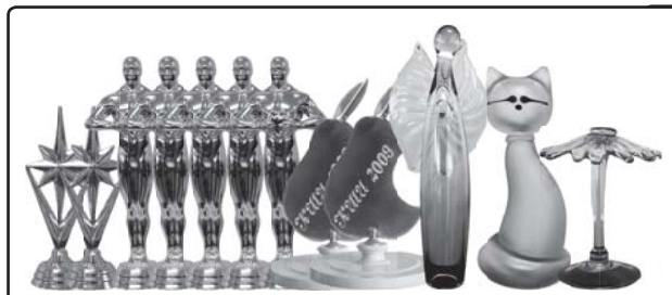
газета выходит с сентября 2004 года