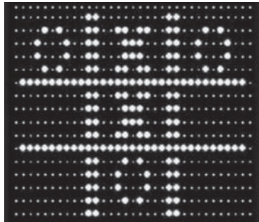
OXO – первая компьютерная игра

Вот такую информацию о пользе и истории компьютерных игр я нашёл в Интернете.