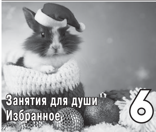
Занятия для души Избранное