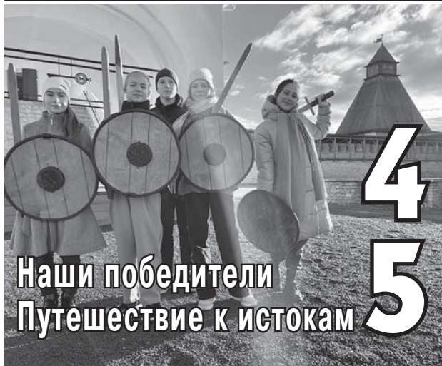
Наши победители Путешествие к истокам