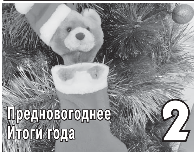
Предновогоднее Итоги года