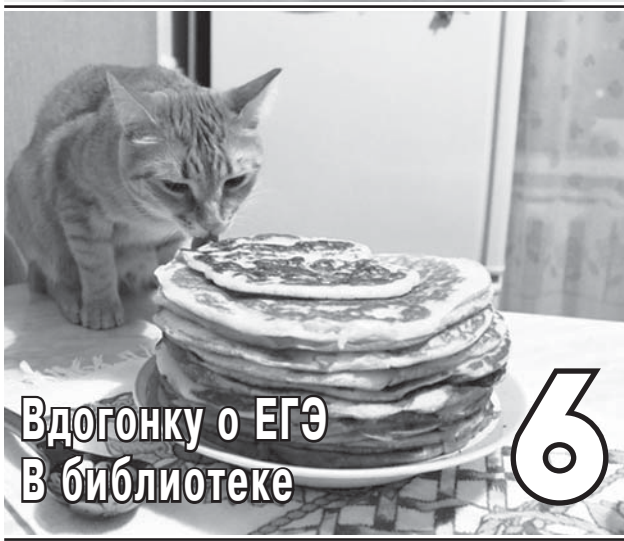
Вдогонку о ЕГЭ В библиотеке

И, конечно же, как безопроса, посвящённого главной теме номера: «Кто главнее? Кто важнее?» Наши журналисты выясняли, какие профессии и обязанности сейчас считаются мужскими, а какие женскими. Отдельная большая тема номера — Интернет-безопасность. Злободневна как никогда, последствия могут быть самыми неприятными. От первого лица мы рассказываем об олимпиадах; о сетевом взаимодействии школ Тосненского района; пишем о вкусном и полезном меню гимназической столовой. Вдогонку читайте о репетиции нашего любимого ЕГЭ и о Дне книги в Никольской городской библиотеке. С праздниками вас поздравляем, читатели газеты «ВМЕСТЕ»!