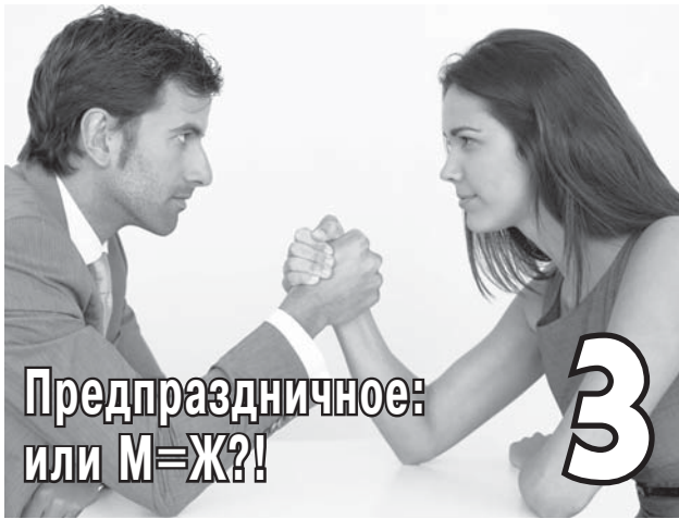
Предпраздничное: или М=Ж?!