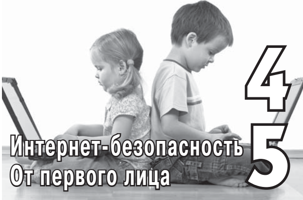
Интернет-безопасность От первого лица