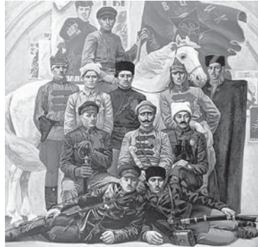
Советский плакат из открытых источников

После того как Германия нарушила заключённое с Россией перемирие и начала наступление, советское правительство обратилось 22 февраля 1918 года к народу с подписанным В.И. Лениным декретом-воззвани-