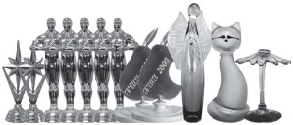
газета выходит с сентября 2004 года