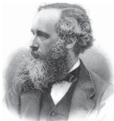
Джеймс Клерк Максвелл

Во второй день был теоретический тур, который длился всего 4 часа. Нам предложили для решения 4 задачи. Самыми интересными, на мой взгляд, были первая и последняя. Одна из них на кинематику. В движущейся трубке (0.1 U) с торцевыми стенками находи-