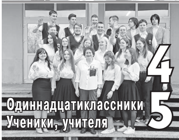
Одиннадцатиклассники Ученики, учителя