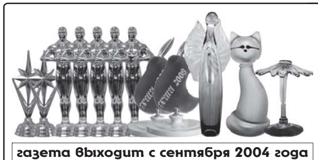
газета выходит с сентября 2004 года