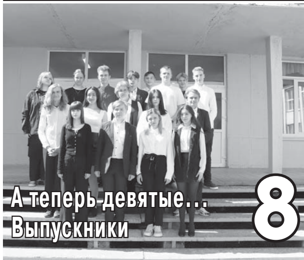
А теперь девятые... Выпускники