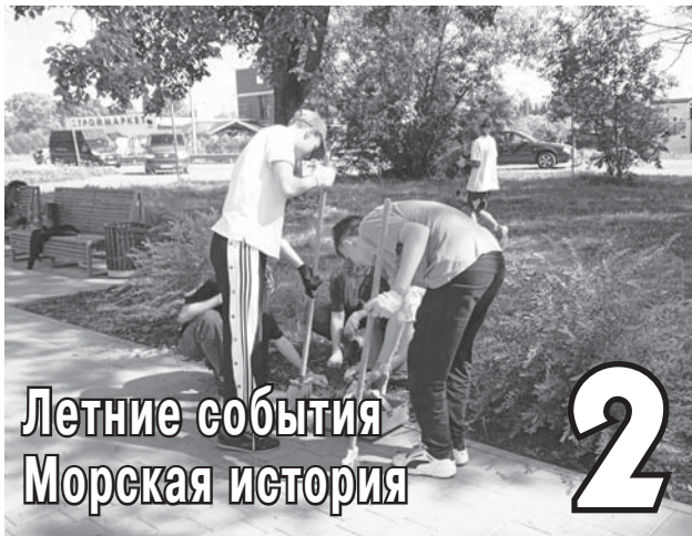
Летние события Морская история