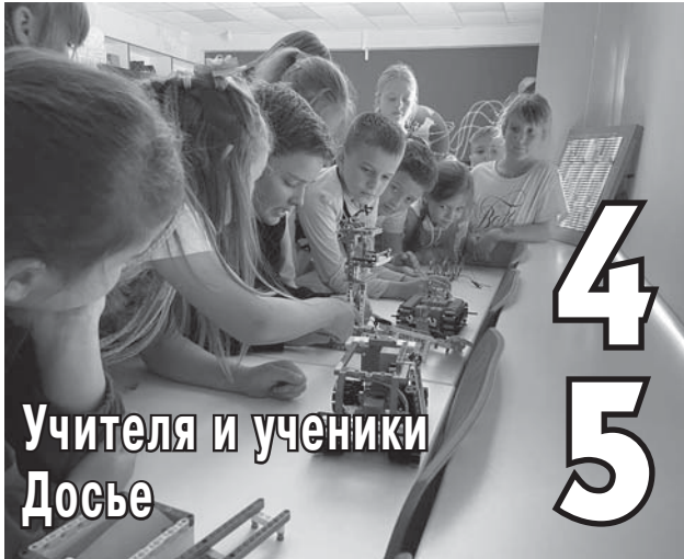
Учителя и ученики Досье