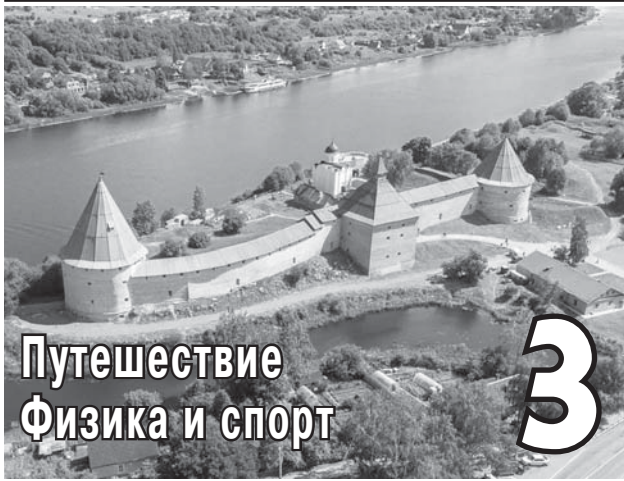
Путешествие Физика и спорт