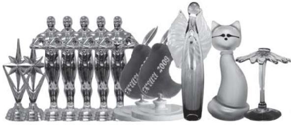
газета выходит с сентября 2004 года