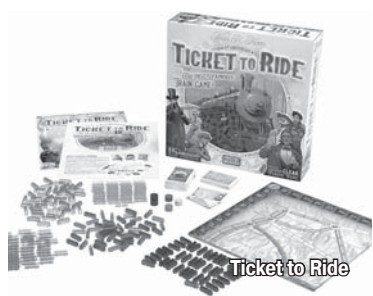
Ticket to Ride