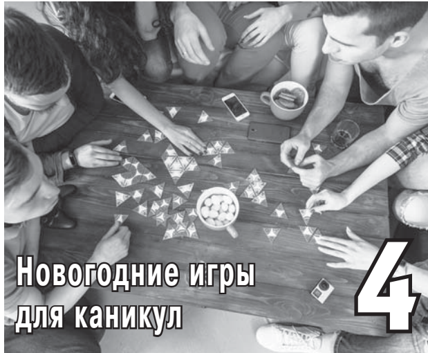
Новогодние игры для каникул 4