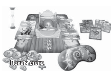
Пока я сплю