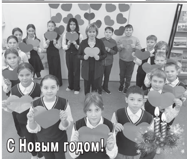
С Новым годом!