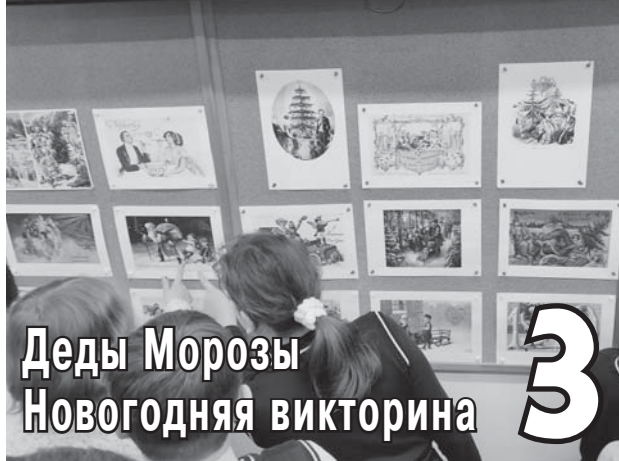
Деды Морозы Новогодняя викторина 3