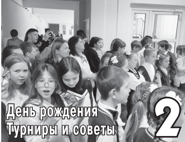
День рождения Турниры и советы 2