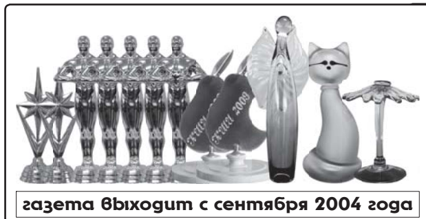
газета выходит с сентября 2004 года