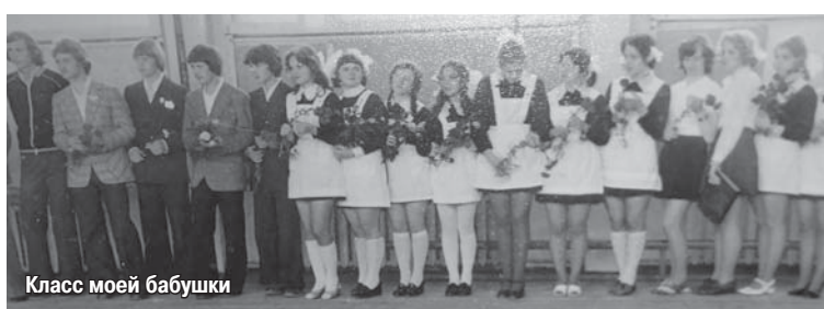
Класс моей бабушки

Кстати, в нашей школе училась и моя тётя, на фото её класс.