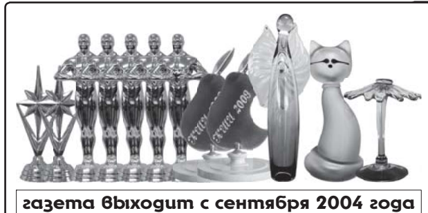
газета выходит с сентября 2004 года