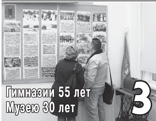
Гимназии 55 лет Музею 30 лет