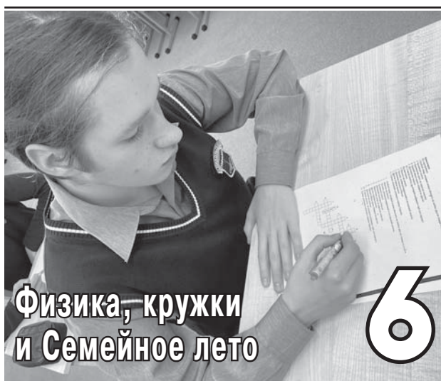
Физика, кружки и Семейное лето