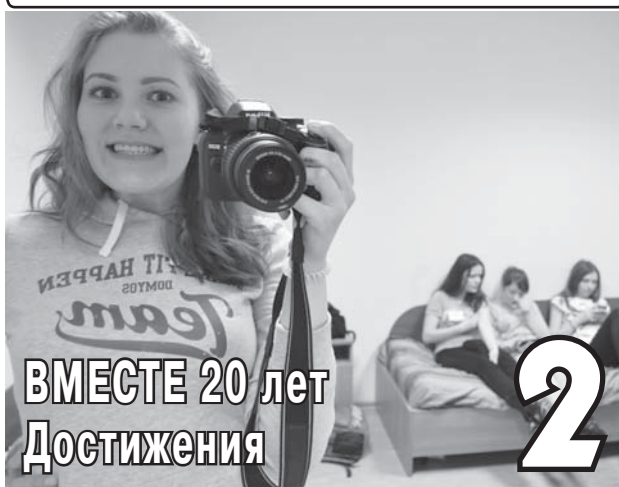
ВМЕСТЕ 20 лет Достижения